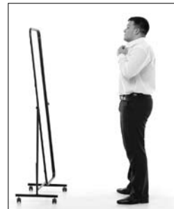
6. to _____ by appearances