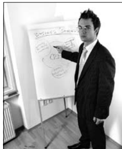
5. an _____ point