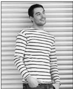
4. to fit _____