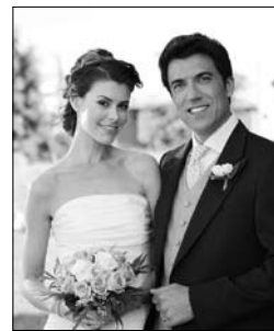
3. a _____ occasion