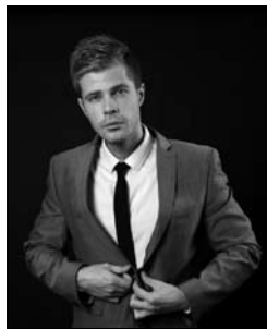
2. to _____ an impression