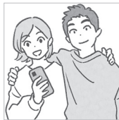
铃木 日本人 哥哥 手机