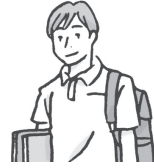
大学生 dàxuéshēng 大学生