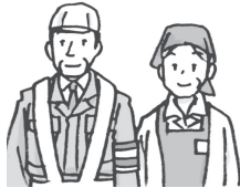
兼职人员 jiānzhírényuán パートタイム