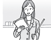
老师 lǎoshī 先生