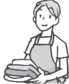
家庭主妇 jiātingzhǔfù 専業主婦