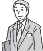
公司职员 gōngsīzhíyuán サラリーマン