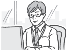
工程师 gōngchéngshī エンジニア