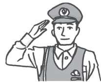
公务员 gōnggōngwùyuán 公務員