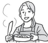
家庭 主妇 jiāting zhǔfù 専業主婦