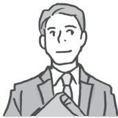
公司 职员 gōngsī zhíyuán サラリーマン