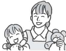
保育员 bǎoyùyuán 保育士