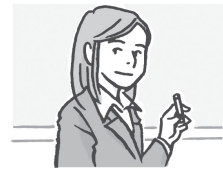
老师 lǎoshī 先生