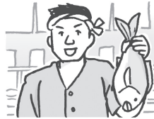
个体户 gètīhù 自営業