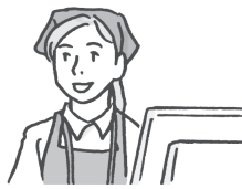
计时 工人 jìshí gōngrén パートタイマー