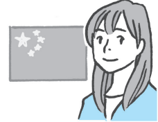
中国人 Zhōngguó rén